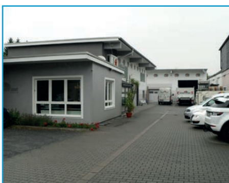
Der Firmensitz in Groß-Bieberau

Zu dem Mehr an Leistungen gehören beispielsweise ganzheitliche Leistungen, auch unter Einbeziehung anderer Gewerke. Dabei übernimmt man selbstverständlich die Federführung und Koordination, damit die Kunden es nur mit einem Ansprechpartner zu tun ha-