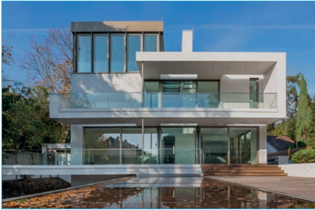
Auch das Moderne ist der Firma Steuernagel & Lampert GmbH & Co. KG nicht fremd.