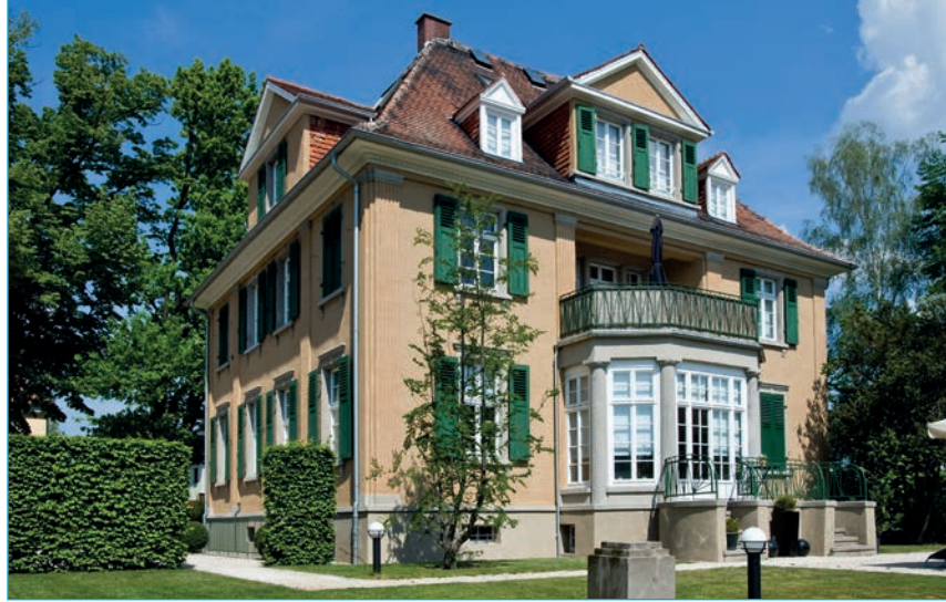
Für die Putz- und Stuckarbeiten an der Villa Hero in Groß-Gerau wurde die Firma Steuernagel & Lampert GmbH & Co. KG mit dem „Bundespreis für Handwerk in der Denkmalpflege“ ausgezeichnet.